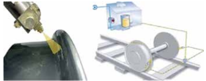
Beispiel eines Schmiersystems